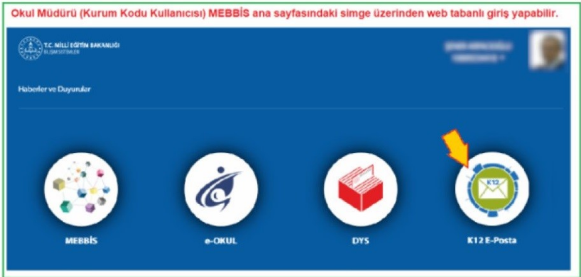
Kurum Müdürü (Kurum Kodu Kullanıcısı) MEBBİS Ana Ekranda Giriş Yapabilir.