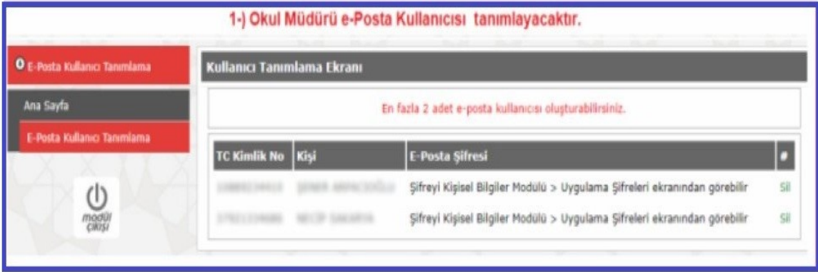
Resmi Kurum E-Posta Kullanıcı Tanımlama Ekranı